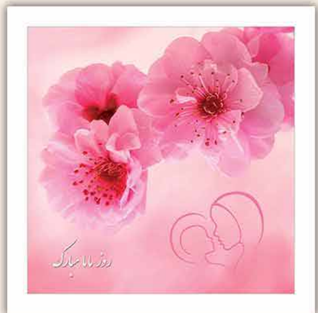
M - 104