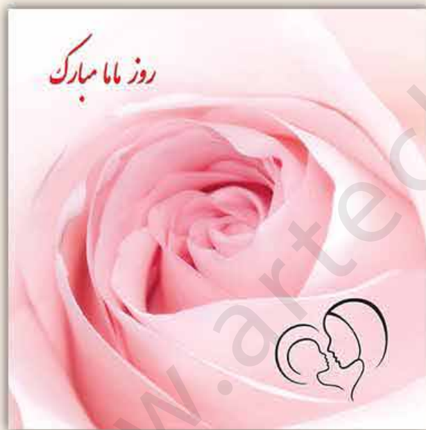
M - 101