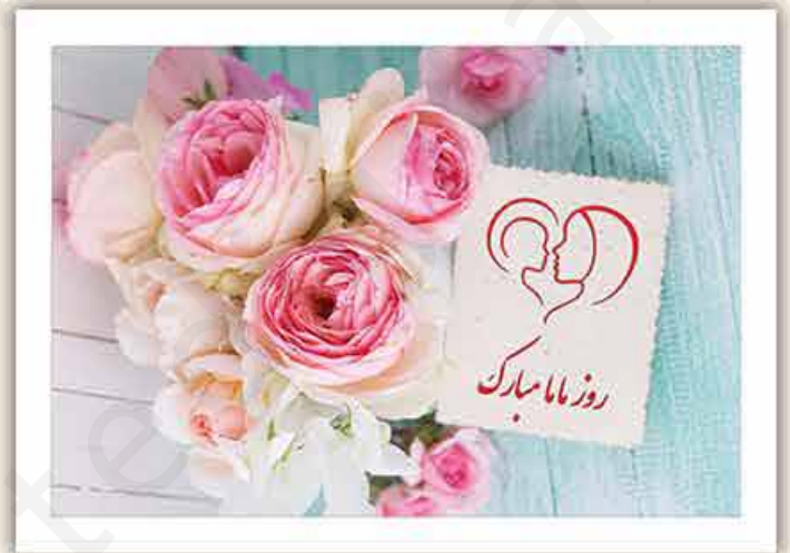
M - 109