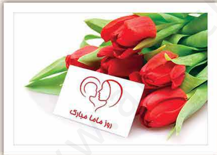
M - 108