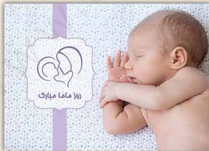
M - 110