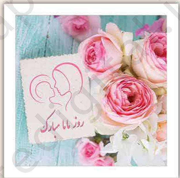
M - 102