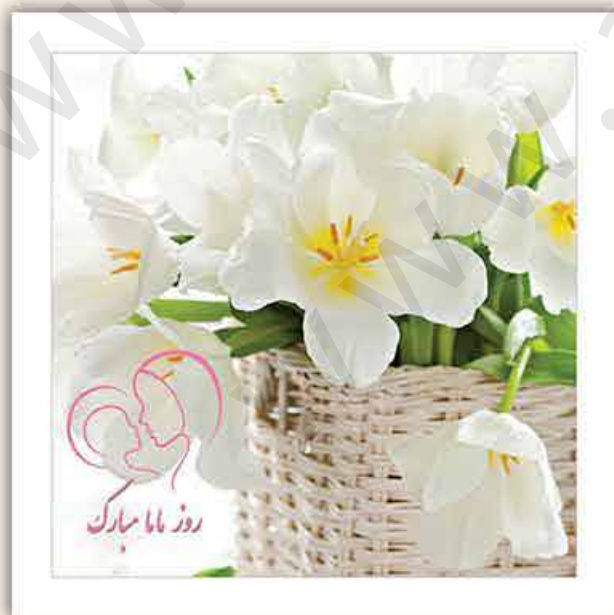
M - 103